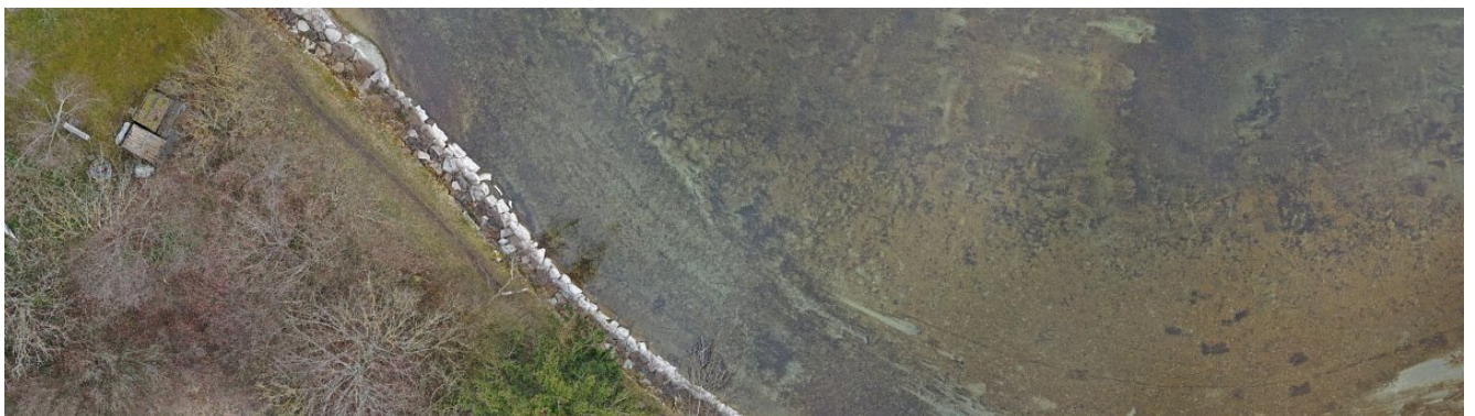
Ausschnitt aus dem georeferenzierten, sehr hochaufgelösten Orthophoto im Uferbereich mit unterschiedlichen Wassertiefen