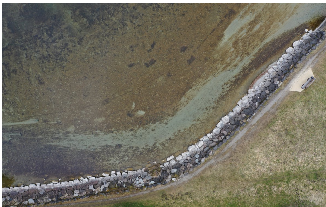
Orthophoto-Ausschnitt mit sehr guter Einsicht bis auf die Rheinsohle