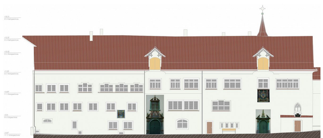
Teil des Fassadenplanes West