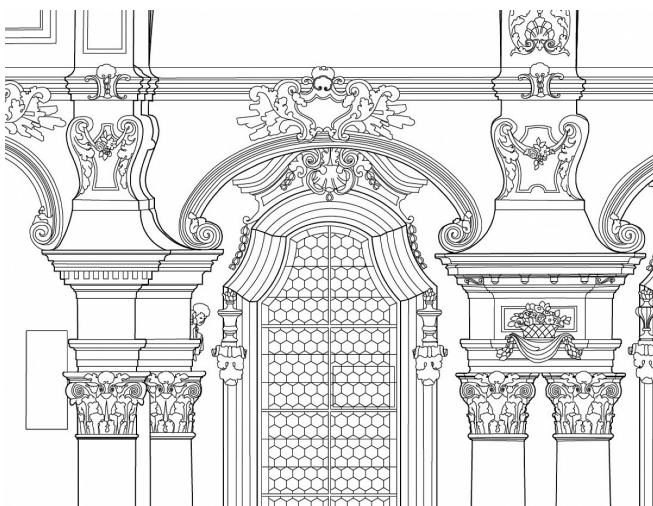
Ausschnitt der Kircheninnenseite CAD-Plan