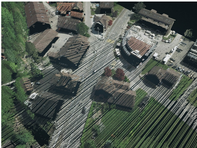
Mit Orthophoto eingefärbte 3D-Punktwolke aus kantonalen Daten

Mit dem Wissen wo welche Daten zu finden sind und wie man diese weiterverarbeitet, kann eine Menge Aufwand gespart werden. Mit automatisierten Workflows können die Daten für weitere Analysen und Prozesse bereitgestellt werden.