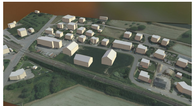
3D-Modell mit bestehender und geplanter Bebauung